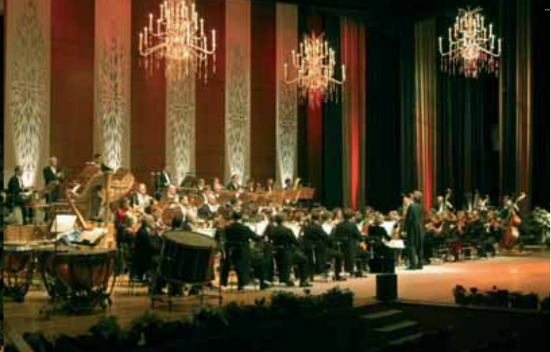
Dresdner Philharmonie Kulturpalast

Dresdner Zwinger , Marmorsaal www.dresden-theater.de