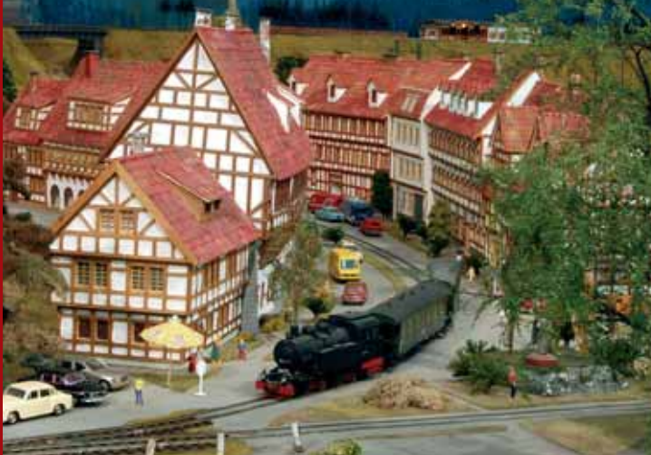
Verkehrsmuseum Dresden Modelleisenbahnanlage Spur o

„Mein schönstes Weihnachtsgeschenk – gestern und heute“ 27.11. – 30.12.2009 täglich 10 bis 20 Uhr