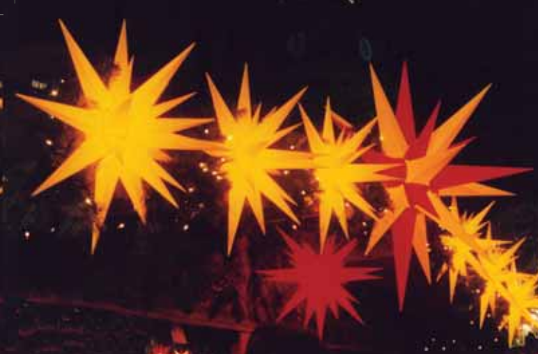
Herrnhuter Sterne auf der Münzgasse

In diesem Jahr wird Dresden durch einen neuen Weihnachtsmarkt bereichert.