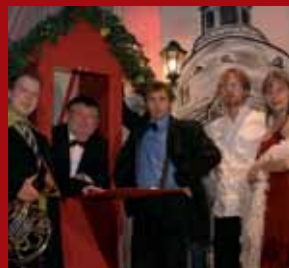
Dresdner Kabarett Breschke & Schuch

Theaterkahn Dresdner Brettl Terrassenufer/Augustusbrücke www.theaterkahn-dresden.de