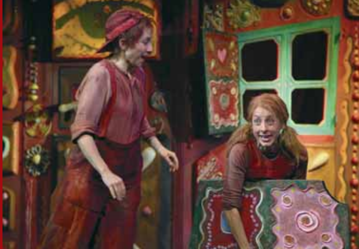
Staatsoperette Dresden „Hänsel und Gretel“

Eine Weihnachtsgeschichte Ballett nach Charles Dickens 2. und 15.12.2009, 10 Uhr 6.12.2009, 11 Uhr 22.12.2009, 18 Uhr 27.12.2009, 17 Uhr