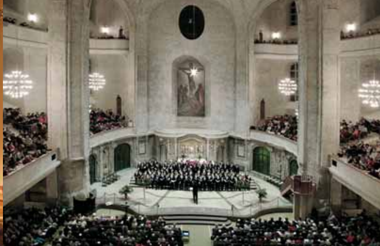
Adventsvesper in der Kreuzkirche

Frauenkirche , Neumarkt www.frauenkirche-dresden.de