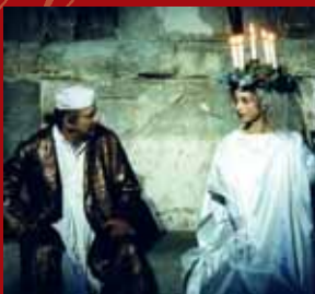
Staatsschauspiel Dresden „A Christmas Carol“