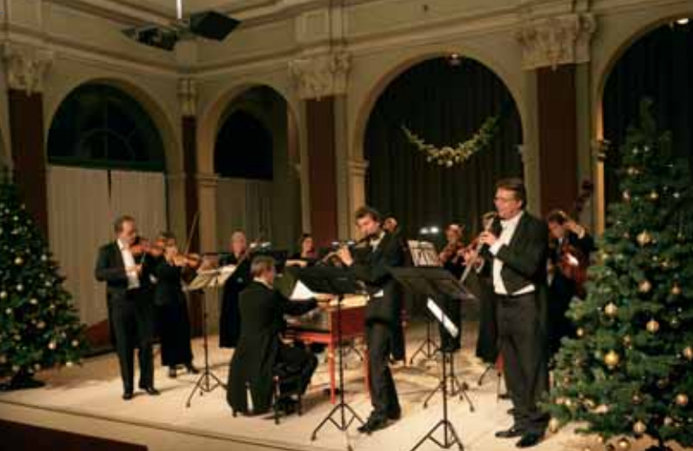
Weihnachtskonzert im Zwinger