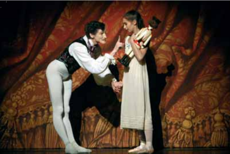
Semperoper Dresden „Der Nussknacker“