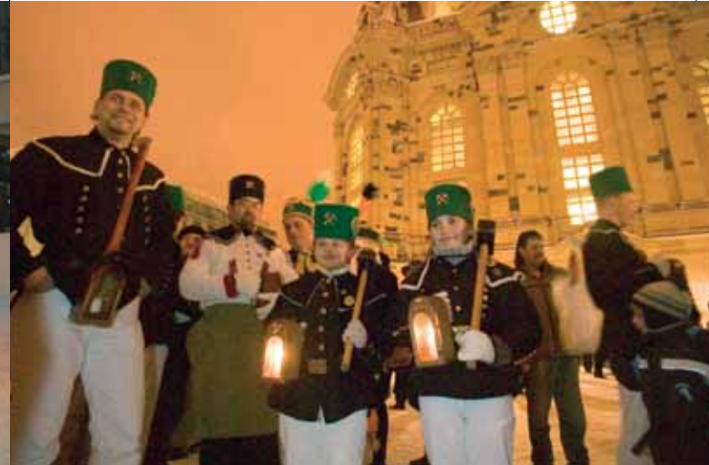
Vor der Frauenkirche