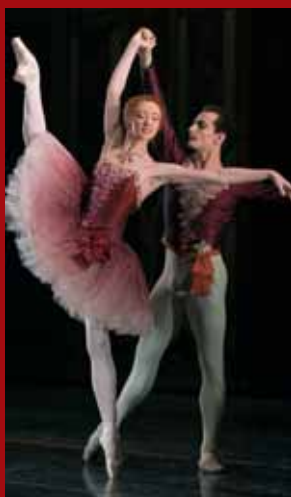
Semperoper Ballett „Der Nussknacker“