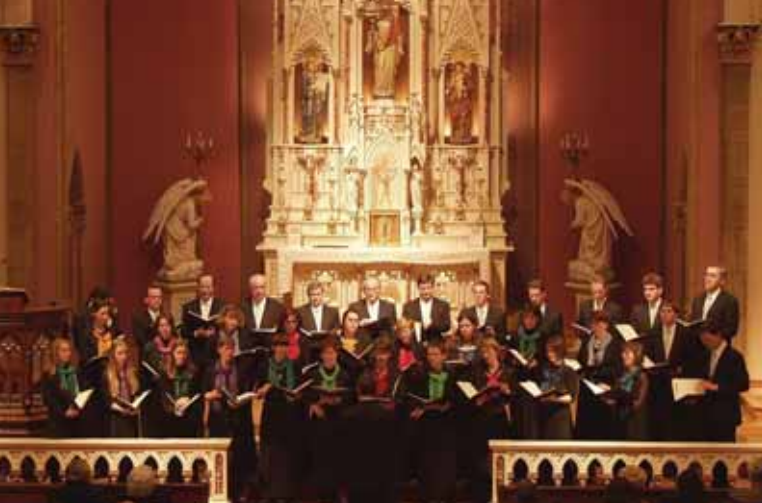
Weihnachtskonzert in der Lukaskirche