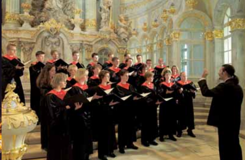
Weihnachtskonzert in der Frauenkirche