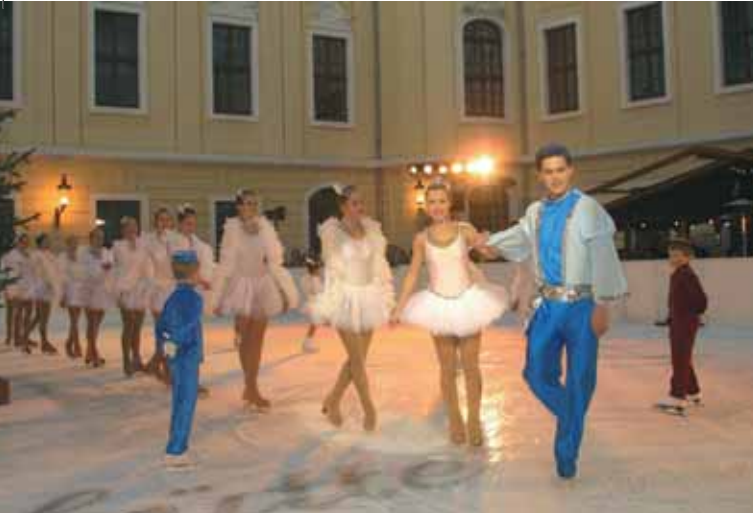
Eisbahn im Innenhof des Kempinski Hotel

Museum für Sächsische Volkskunst , Jägerhof Köpckestraße 1 Advent und Weihnachten im Jägerhof 2009 „20 Jahre danach“ Spielzeug aus der DDR 28.11.2009 – 21.2.2010