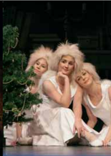
Landesbühnen Sachsen „Eine Weihnachtsgeschichte“