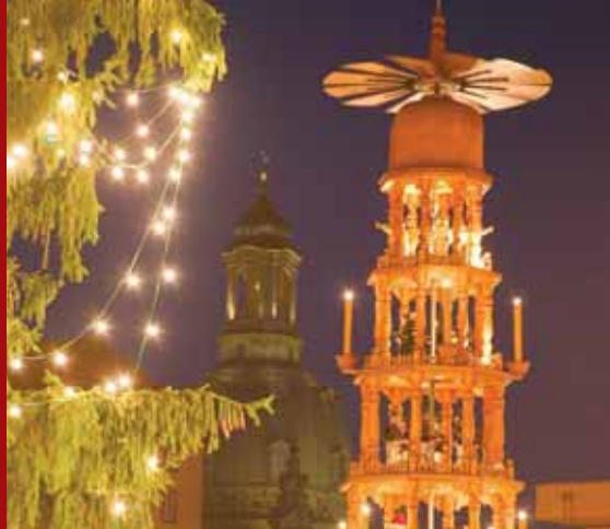
Pyramide auf dem Striezelmarkt