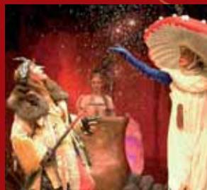
Komödie Dresden „Die Hexe Baba Jaga“

staltet, wird sicher Vergnügen bei der Operette von Johann Strauß „Die Fledermaus“ finden.