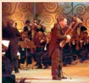
Dresdner Philharmonie Neujahrskonzert

Dresdner Bläserweihnacht Virtuose Bläsermusik zu Weihnachten aus vier Jahrhunderten 28.12.2009, 20 Uhr